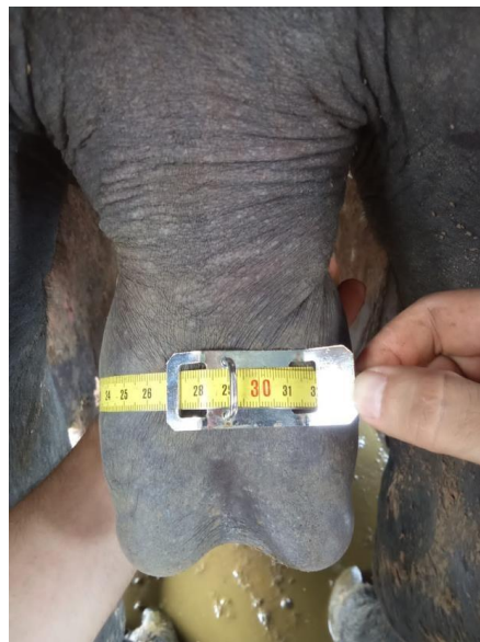
Figura 2 Proceso de medición con escrotímetro

Esto permite inspeccionar las características morfométricas de las estructuras anatómicas, la medición en centímetros de la circunferencia escrotal en una línea media de la totalidad de la longitud de los testículos, se realiza una presión adecuada en el escrotímetro, que permita remover la piel y solo contemplar el valor del parénquima testicular como se observa en la Figura 2. De igual forma se realiza la medición de la longitud del testículo y el ancho utilizando el pie de Rey como se muestra en la Figura 3 (Hyppolito, 2019; Leandro, 2022).