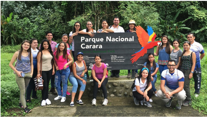
Figura 11. Mediante la recreación turística y la recreación al aire libre, la población del PARE tiene acceso a los beneficios de la recreación mientras cursan su carrera universitaria. Conocer nuevos lugares mientras comparten con personas en la misma situación, son algunos de los beneficios para la población participante.