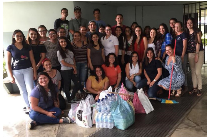
Figura 10. En la foto se muestra un grupo de la carrera de Contabilidad y finanzas entregando víveres al grupo de liderazgos, el cual había organizado una recolecta para estudiantes afectados por un huracán en octubre de 2017.

Las acciones orientadas desde grupos como el de Liderazgos, se proyectan hacia toda la comunidad universitaria en un efecto multiplicador, que busca el involucramiento constante en las actividades que propicien el desarrollo integral de la comunidad estudiantil (ver figura 10).