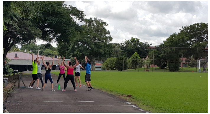
Figura 6. Talleres sobre ejercicio físico y salud. La universidad se empezó a concebir, por la población estudiantil, como un entorno donde tienen la oportunidad de practicar actividades a las que no tenían acceso anteriormente. Asimismo, mejorar su estado físico y emocional a través del ejercicio, ha sido una consigna del área de recreación.