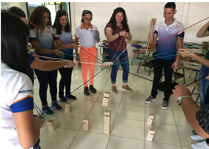
Figura 9. La formación de valores, actitudes y aptitudes como el carácter, respeto, responsabilidad y trabajo en equipo, son parte de los objetivos que pretenden los grupos estudiantiles que trabajan voluntariamente por el mejoramiento de la institución.

En este caso particular, el Grupo de Liderazgos estudiantiles, se propuso como una oportunidad para que la comunidad estudiantil tenga la posibilidad de proponer y trabajar en conjunto, en aspectos atinentes al mejoramiento de la vida estudiantil y de la universidad en general (ver figura 9).