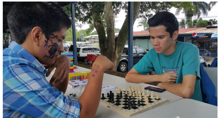
Figura 7. Celebración del Día del niño, Sede Central, 2017. La organización de actividades en las cuales la población estudiantil participa de manera voluntaria, se reforzó para el segundo año del programa recreativo.