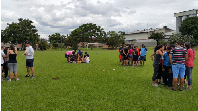
Figura 4. Festival recreativo, Sede Central 2016. Esta fue la primera experiencia recreativa organizada con un objetivo específico para la población estudiantil. Participaron 2 grupos de diferentes carreras que ofrece la institución.

oferta de actividades recreativas. En muchas ocasiones, las personas no participan de las actividades por vergüenza o porque no consideran ser hábiles para lo que se está desarrollando. La recreación vicaria (primero observar a otras personas desarrollando la actividad) ha ido rompiendo ese paradigma y ha hecho que la población estudiantil se involucre cada vez más en las actividades (ver figura 5, 6, 7 y 8).