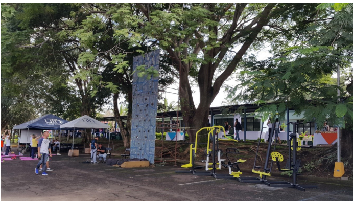
Figura 5. Feria de la Salud, Sede Central 2016. El uso de las actividades institucionales para transversalizar la recreación en la comunidad estudiantil ha sido una importante herramienta en la concientización y consolidación de los beneficios de la recreación para las personas.