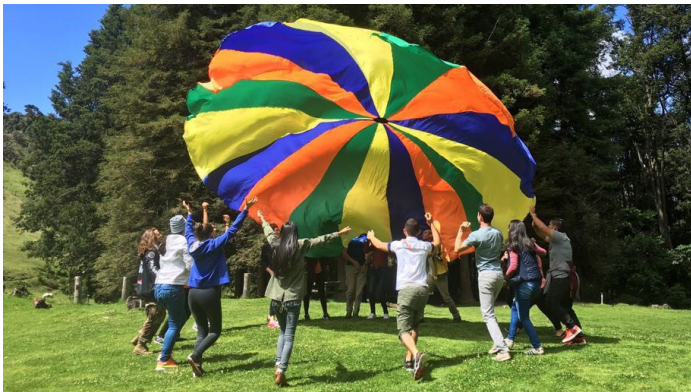
Figura 12. Los beneficios personales de la recreación en la población estudiantil del PARE, generan un estado de bienestar, donde la persona se siente parte de un grupo de apoyo y puede compartir vivencias que le ayudan a crecer personal y socialmente, dentro del ambiente universitario y como ciudadano en general.