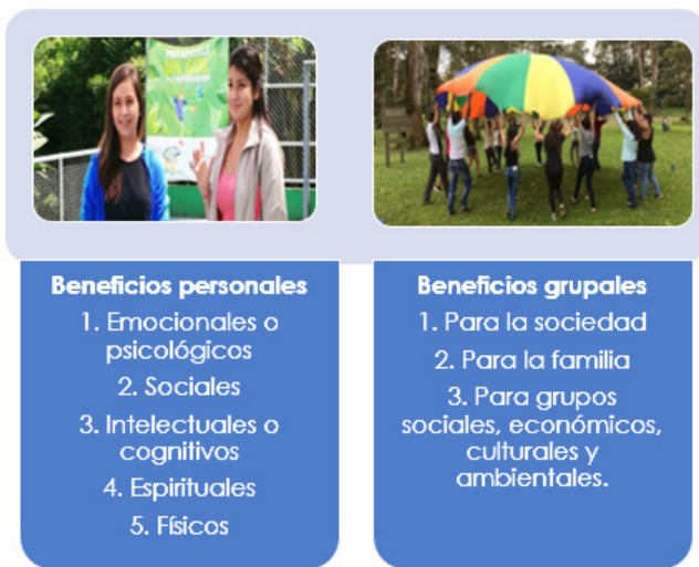
Figura 2. Beneficios de la recreación. Tomado de Salazar (2017, p.76).

La recreación es tan amplia como sus beneficios para las personas. Muchas actividades de la vida son recreación, y las personas no suelen estar conscientes que la practican y se benefician de ella. Es de gran importancia reconocer y entender la recreación y su efecto en las personas. Salazar (2017) categoriza los beneficios de la recreación de la siguiente forma, en la figura 2: