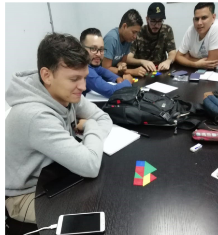
Comunidad diseñando un prototipo.