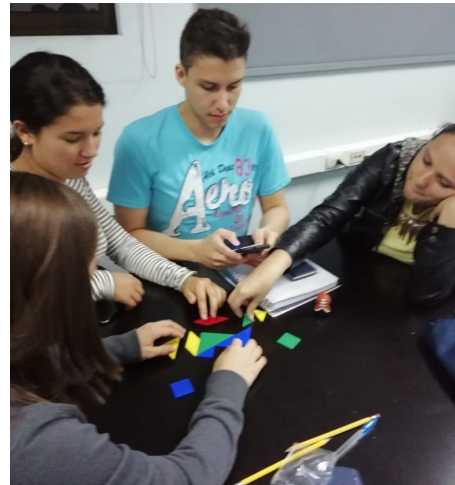
Comunidad diseñando un prototipo.