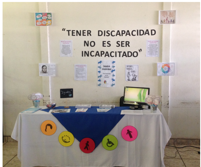
Figura 1: Evidencias del taller. Carteles elaborados por estudiantes con frases y slogan sobre discapacidad.

La docente a cargo de la experiencia autorizó el uso de las fotografías en la Revista A. Arjé.