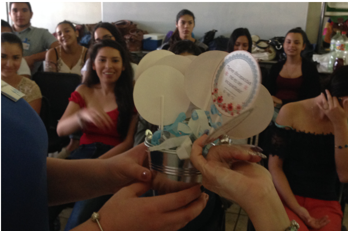
Figura 3: Evidencias del taller. Dinámicas organizadas para el desarrollo de la temática.