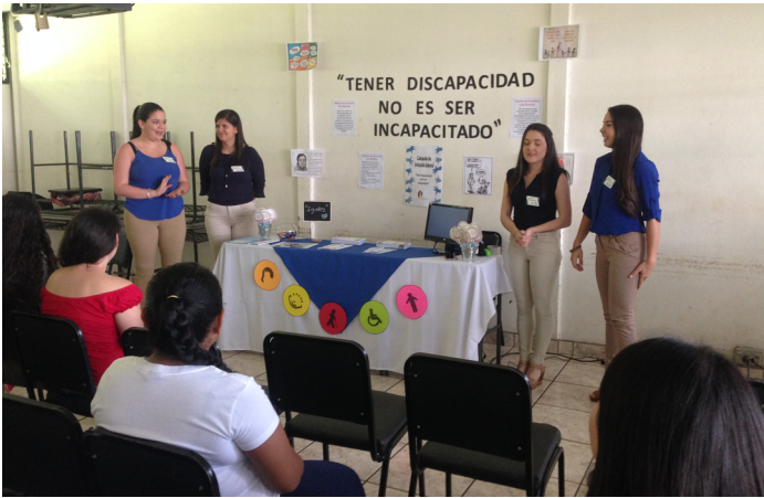
Figura 2: Evidencias del taller. Presentación de la temática por parte de estudiantes.