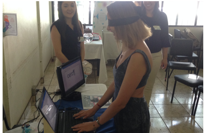
Figura 6: Evidencias de la actividad Ponte en mi lugar. Estudiante con sus ojos vendados tratando de realizar una tarea en la computadora.