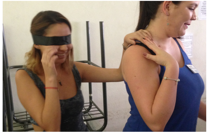
Figura 5: Evidencias de la actividad Ponte en mi lugar. Estudiante con los ojos vendados, siendo guiada por otra.