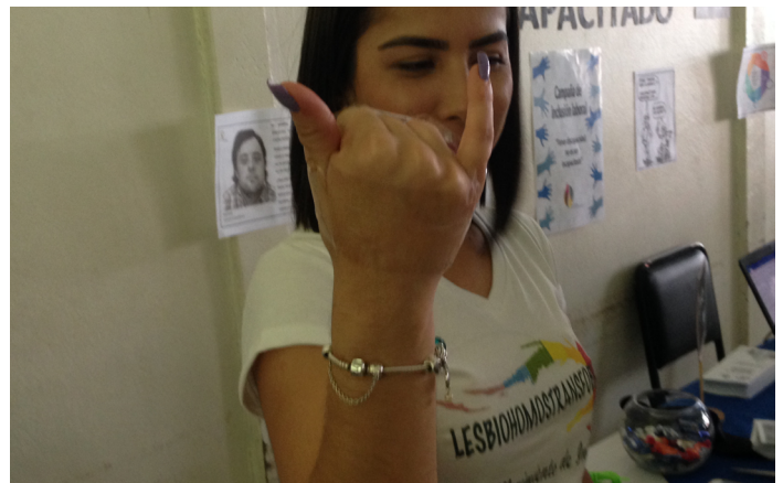
Figura 7: Evidencias de la actividad Ponte en mi lugar. Estudiante realizando actividades con sus dedos amarrados, con solo movilidad en el pulgar y meñique.

La docente a cargo de la experiencia autorizó el uso de las fotografías en la Revista A. Arjé.