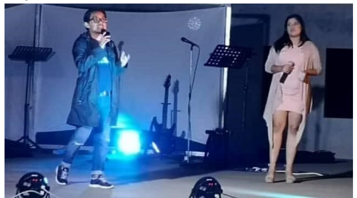
Figura 2: Festival de Talentos. Encuentro Senuk, Explanada Módulo 6. 31 de enero, 2019.

Asimismo, he desarrollado la competencia de comunicación asertiva, tanto para eventos formales como presentaciones, exposiciones, representaciones, videos institucionales, así como, informales, como fue el caso del Festival de talento, en la Sede Central, donde fui presentador y moderador, lo que requería interacción con el público. Esto me ha permitido generar un cambio de chip según el contexto en el que me encuentre.