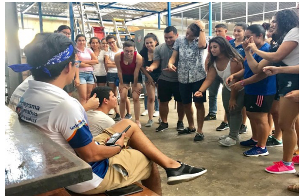
Figura 1: Convivio COFI Sede El Roble, Puntarenas, Costa Rica. 09 de noviembre, 2018.

he sacado provecho a mi personalidad tan extrovertida, desarrollando competencias blandas (competencias para la vida), en primera instancia, mi liderazgo. Este grupo me ha empoderado en diferentes experiencias estudiantiles, al punto de lograr dirigir actividades con grupos de hasta 130 estudiantes de diferentes brechas generacionales.