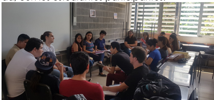
Figura 6: Fotografía de la actividad Mesa Redonda, con los estudiantes participantes.