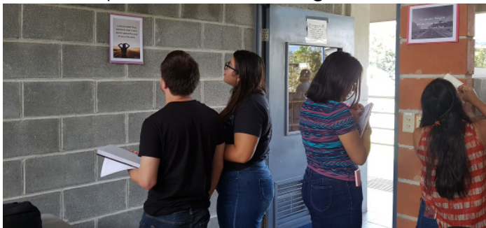
Figura 5: En las paredes del aula se presentaron las frases que conformaban la galería.