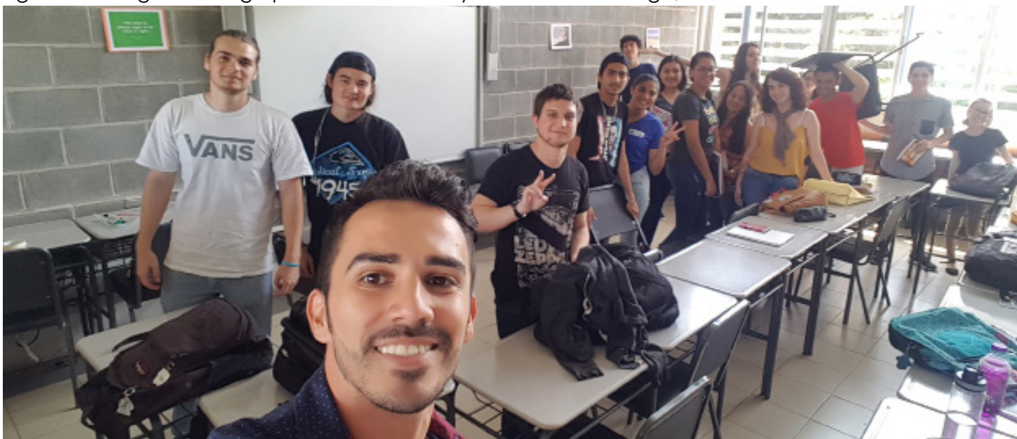
Figura 8: Fotografía del grupo de estudiantes y el docente a cargo, al inicio de la actividad.