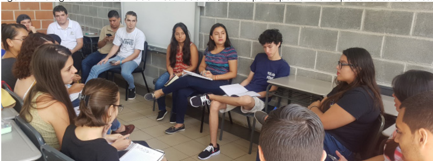
Figura 7: Fotografía de la actividad Mesa redonda, con la participación de las personas estudiantes.