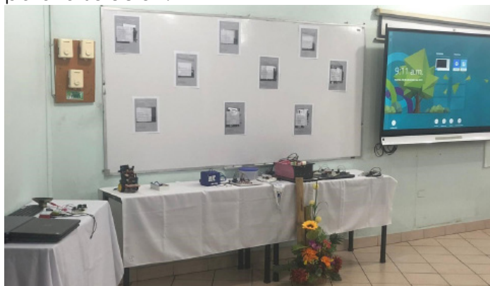
Figura 13. Prototipos electrónicos innovadores para la solución.

La actividad consistió en la presentación de nueve proyectos (ver figura 13) denominados Pastillero Inteligente (ver figura 15), Prototipo circuito electrónico para usuarios con asma persistente (ver figura 16), Registro automático de espiración (ver figura 17), Prototipo de alarma sobre llenado de bolsa urinaria (ver figura 18), Asistente de comunicación electrónico para personas con afasia (ver figura 19), Monitoreo de pulsos cardiacos (ver figura 20), Detector caídas en adultos mayores (ver figura 21), Aplicaciones para silla de ruedas (ver figura 22) y Comunicador lógico de texto a voz (ver figura 23).