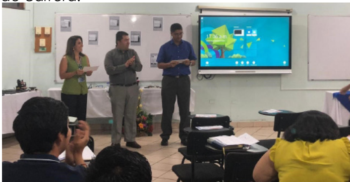
Figura 24. Entrega de certificados de participación por parte de la Dra., el decano y director de carrera.