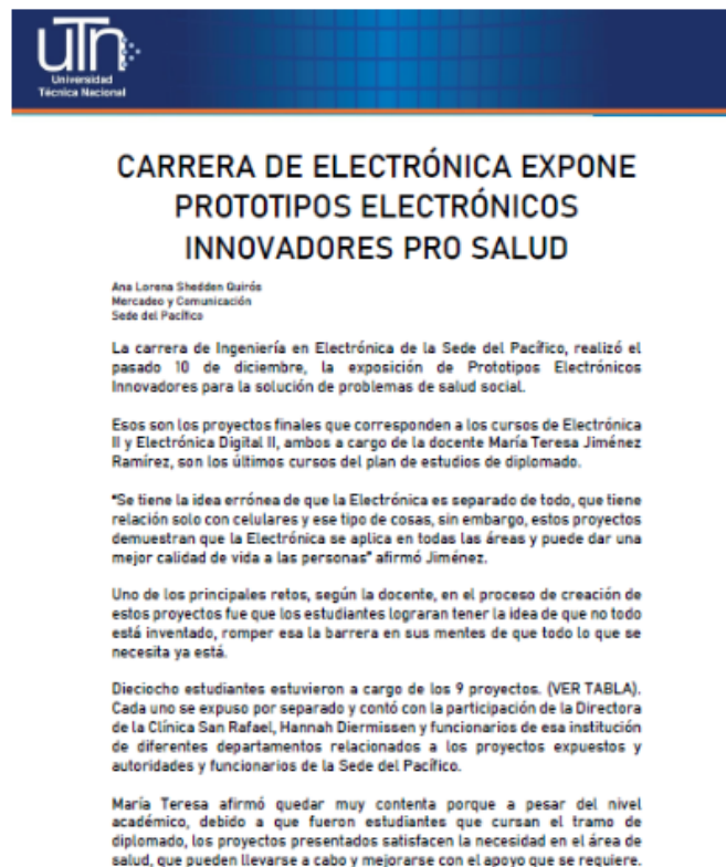
Figura 26. Publicación de la actividad a nivel sede del Pacífico.