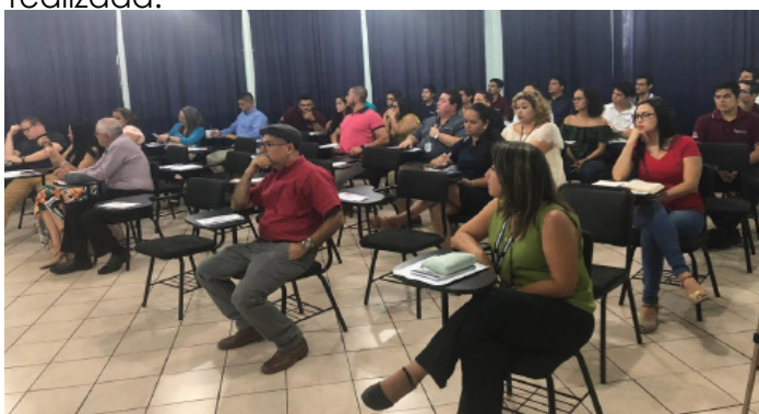
Figura 12. Público espectador de la actividad realizada.