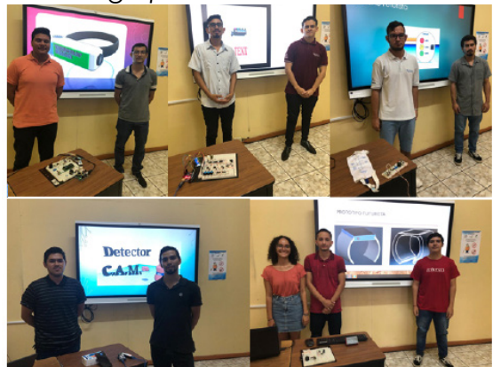
Figura 7. Exposición de práctica para la actividad final del grupo de Electrónica II.