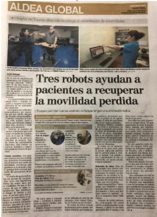
Figura 1. Noticia nacional sobre el uso de dispositivos electrónicos en el país.