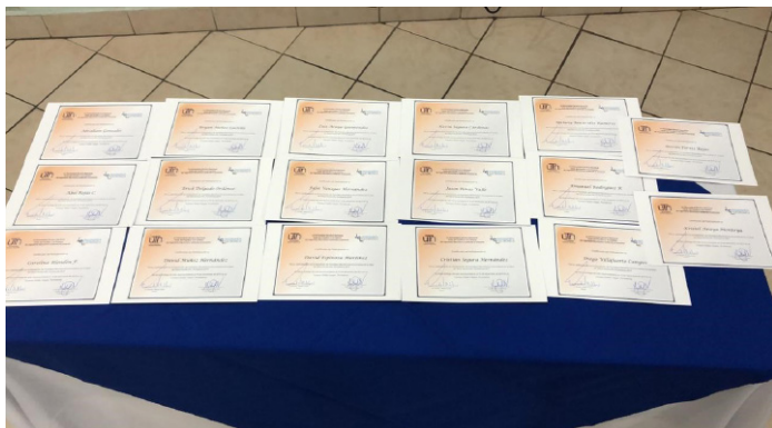
Figura 25. Certificados de Participación.

La autora de este artículo autorizó el uso de las fotografías en la Revista Académica Arjé.