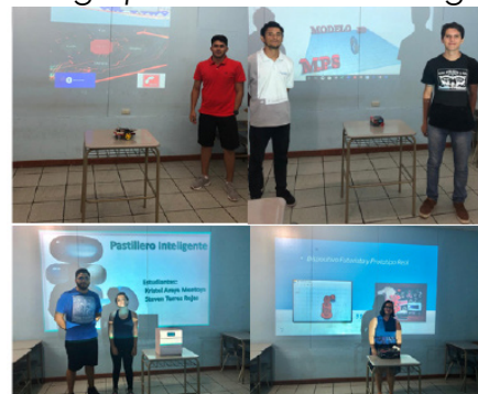
Figura 8. Exposición de práctica para la actividad final del grupo de Electrónica Digital II.