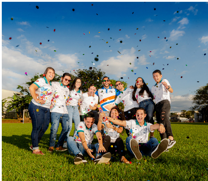
Figura 2. Fotografía de estudiantes participantes en el proyecto.