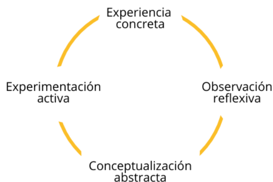
Figura 1. Ciclo del aprendizaje experiencial de David Kolb