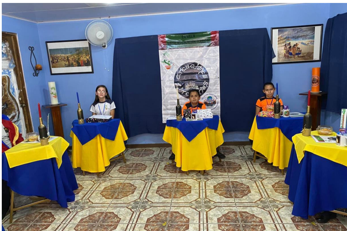
Ganadores del concurso 2021