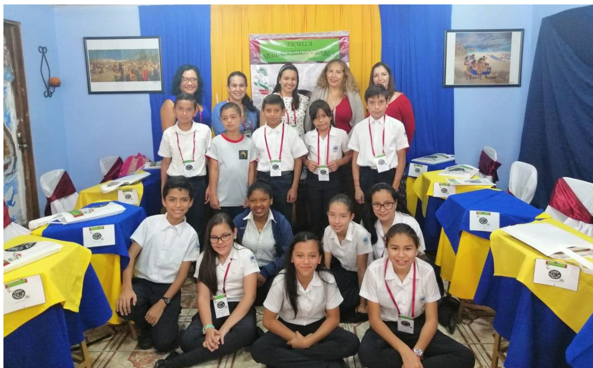
Estudiantes y jueces 2019