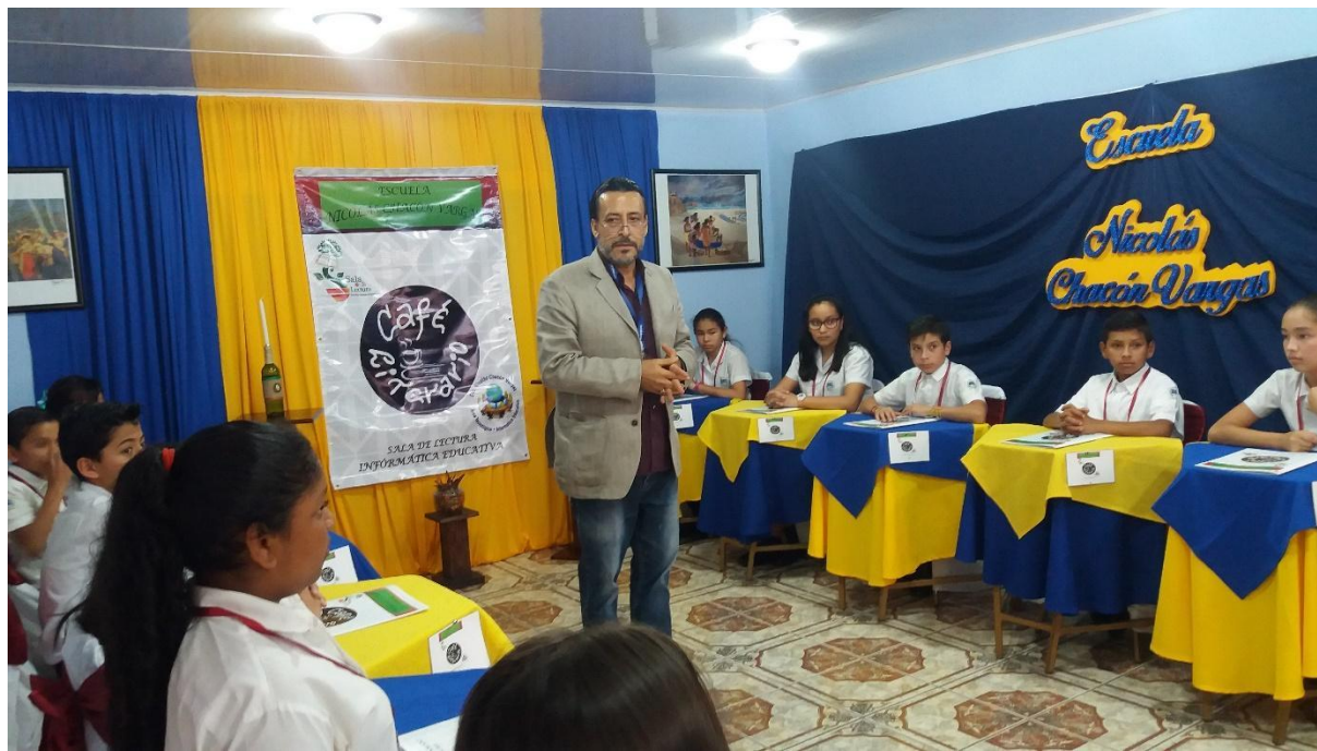
Concurso café literario 2019