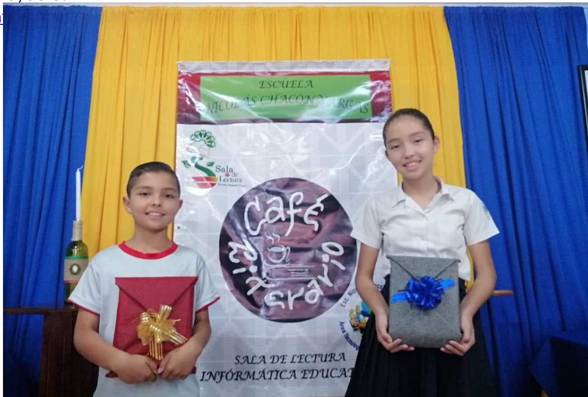
Ganadores del concurso 2019