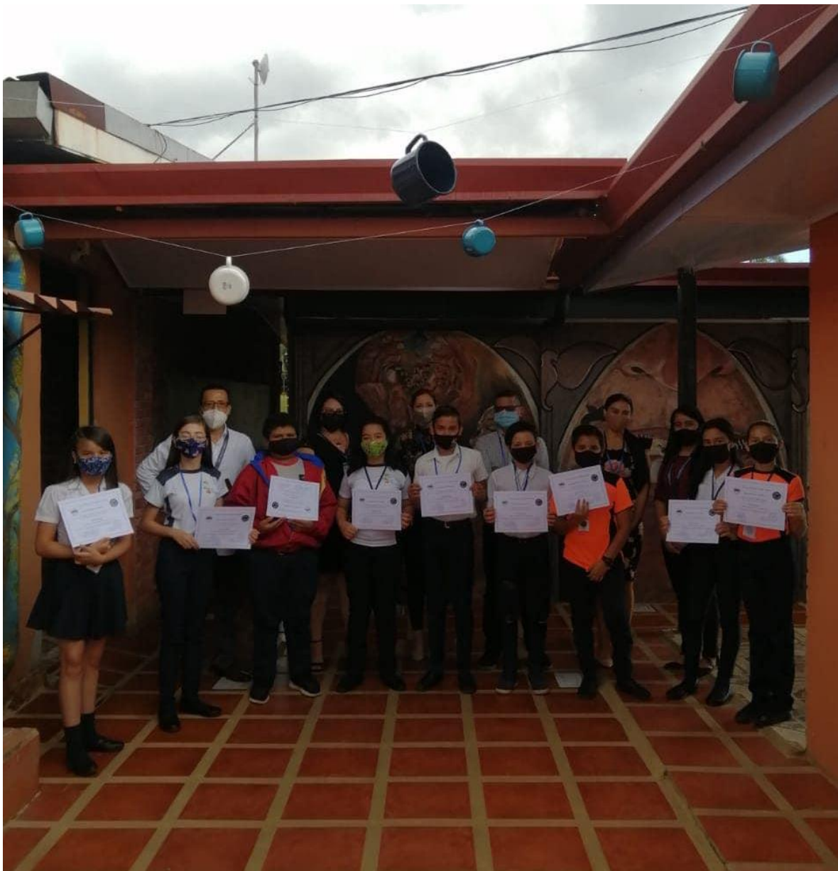
Estudiantes y jurado 2021