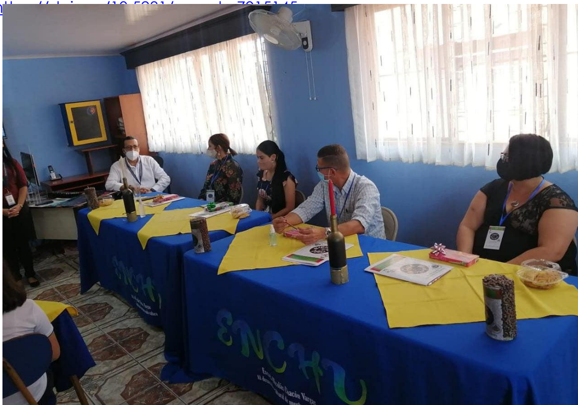
Panel de jurados