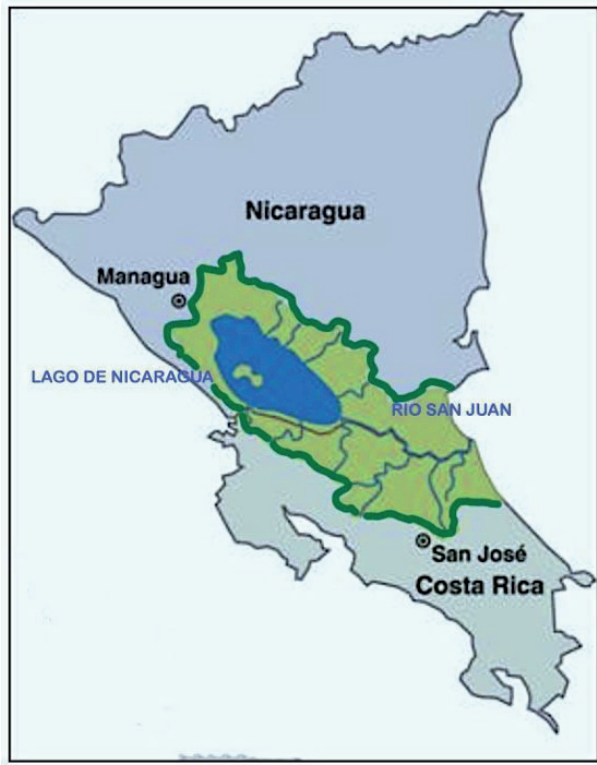
Figura 1. La cuenca del río San Juan.

alta cubierta por bosques fue el obstáculo principal que encontraron los costarricenses durante el siglo XIX para penetrar a la región Norte desde el Valle Central, la región más poblada del país. Por el contrario, desde Nicaragua al norte, se encontró un acceso relativamente más fácil utilizando el Lago y el río San Juan para llegar a la costa del Caribe, así como para que algunos colonos se establecieran en los márgenes de ese río, e incluso penetraran por los ríos Frío y San Carlos.